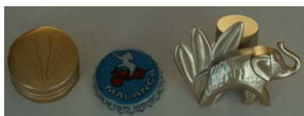
Doppen met een olifant

Haar man was ook vanaf het begin weg van olifanten en daarmee is het ook echt een verzameling van hen samen geworden. Ze verzamelen overigens echt alles waar een olifant op staat of wat een olifant is. Zo hebben ze bijvoorbeeld postzegels, krantenknipsel, doppen, aanstekers, plaatjes, stickers, lepels, vingerhoedjes, munten, pennen, hangertjes, broches, een mobiel, schilderijen, lampjes, speelgoed en van alles meer met olifanten. Zelfs gewone gebruiksvoorwerpen zoals onderzetters, onderbroeken, theedoeken T-shirts en dekbedovertrekken worden bij voorkeur met olifanten gekocht. Ze zijn er meestal niet echt naar op zoek, maar als je dan toch mooie theedoeken, of onderbroeken tegenkomt en er staat toevallig een olifant op dan is dat natuurlijk extra leuk. Er wordt dus echt van alles en nog wat gebruikt in het huishouden met olifanten.