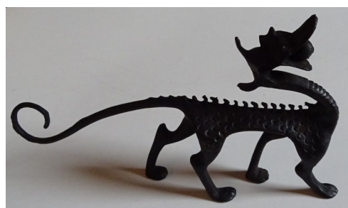
Draakje uit Tibet

Toen ik haar vroeg naar moderne draken, zoals draak Lichtgeraakt van de Efteling en van de 3-D film "Hoe tem je een draak" vertelde ze dat ze die nog niet kende. Ze was wel benieuwd naar die draken en zou er nog graag iets van aan haar verzameling toevoegen.